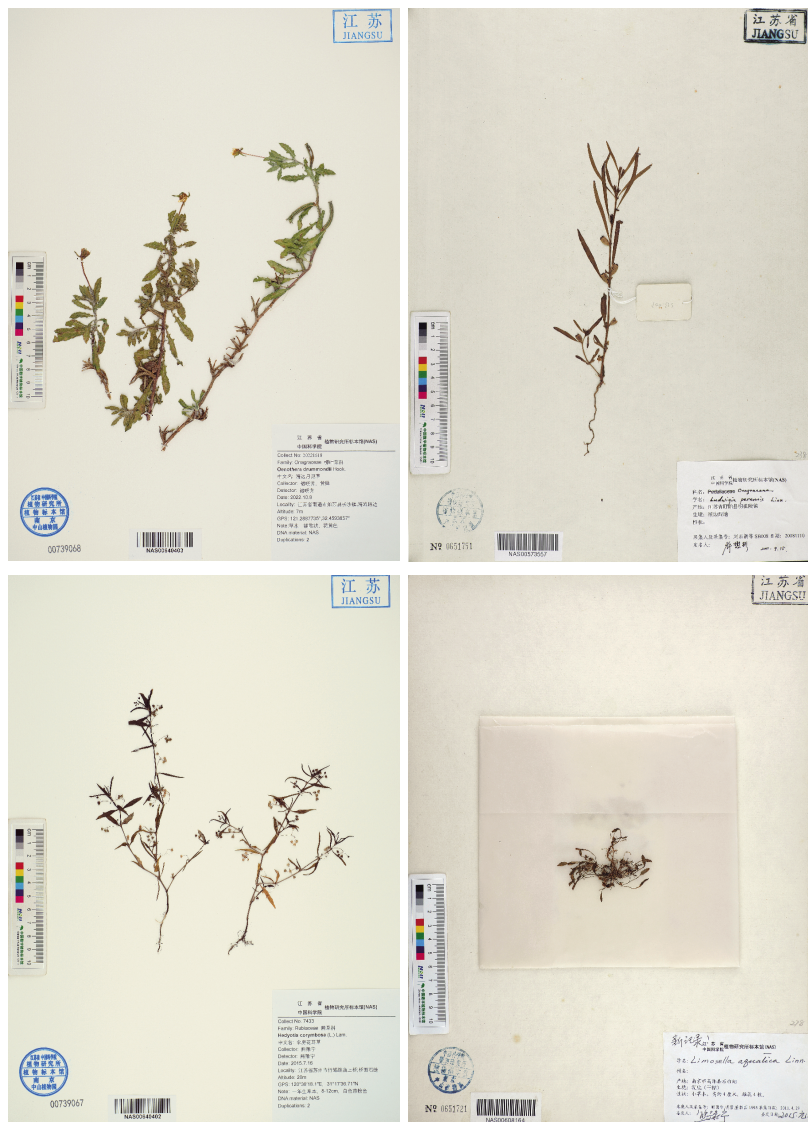
图 2 江苏省湿地被子植物新记录(II) (A) 海边月见草; (B) 细花丁香蓼; (C) 伞房花耳草; (D) 水茫草。

主要特征: 一年生草本。茎四棱形, 多分枝, 呈铺散状。叶对生, 近无柄, 膜质, 线形或狭披针形, 两面稍粗糙, 无侧脉。花通常 2~4 朵, 排列成腋生的伞房花序, 稀退化成单花, 花序梗纤细; 蒴