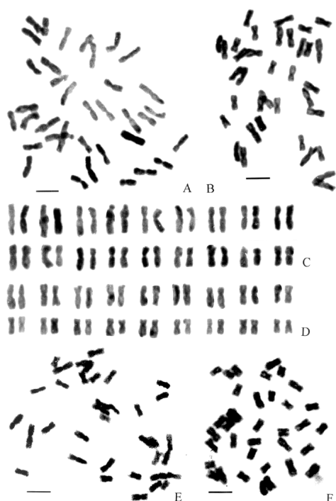
图 1 微糙三脉紫菀有丝分裂中期显微照片和核型图 (标尺 = 4 \mu\text{m} )

9 个微糙三脉紫菀居群的染色体数目均为 36 (其中 6 个居群的有丝分裂中期图见图 1A、B、E、F 和图 2C、D), 未发现 B 染色体. 由于紫菀属 ( Aster L.) 的染色体基数只有一个, 为 x = 9 , 所以微糙三脉紫菀属于四倍体 ( 2n = 4x = 36 ).